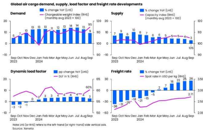
Global air cargo rates continue the climb in September

"그러나 최근 월별 물량은 지속적인 전자상거래 수요, 컨테이너 운송 중단